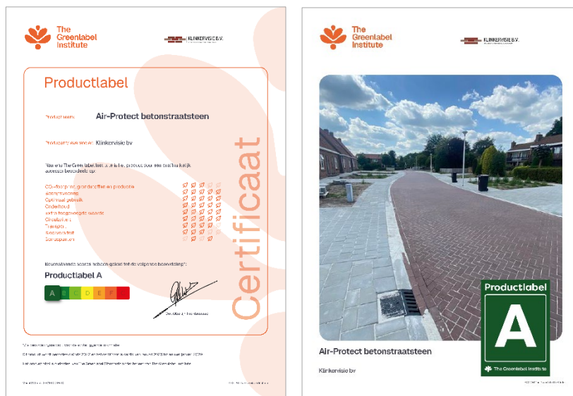
Figuur 1: Voorbeeld Productlabel Certificaat

Sinds 1 juni 2015 voert Stabilitas B.V. in opdracht van The Greenlabel Institute deze beoordeling uit. The Greenlabel Institute geeft vervolgens de samenvatting van de resultaten weer in een certificaat dat met het product wordt meegeleverd. Zo is voor elke eindgebruiker altijd direct inzichtelijk hoe duurzaam iets is. Figuur 1 geeft een voorbeeld van een Productlabel Certificaat.